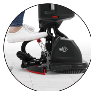
Bediening zuigmond met de voet

Reinigingsprestaties in één handeling worden bereikt door een combinatie van borsteldruk, krachtige aandrijfmotoren en de juiste hoeveelheid water op de juiste plaats. Overschakelen op de 244NX-R levert bij een gebruik van 5 minuten per dag al een besparing op waardoor de machinekosten al in 3 jaar kunnen worden terugverdiend.