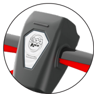
Essentiële elementen en 'touch points' in rood