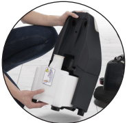
Gemakkelijk vullen en legen van tanks